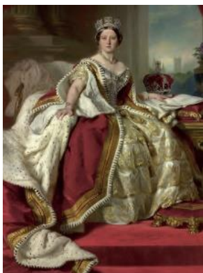
Slika 8. Kraljica Viktorija