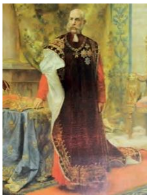
Slika 9. Car Franjo Josip I.