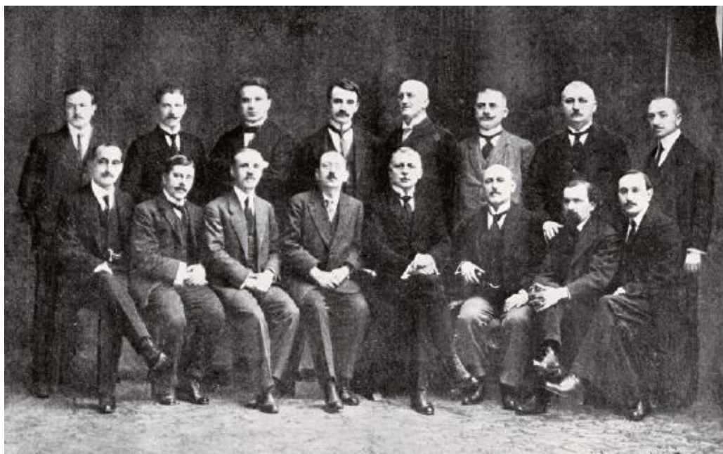
Slika 7. Članovi Jugoslavenskog odbora