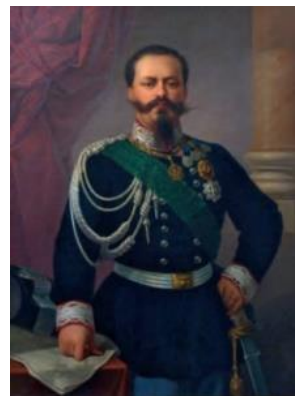
Slika 10. Kralj Viktor Emanuel II.