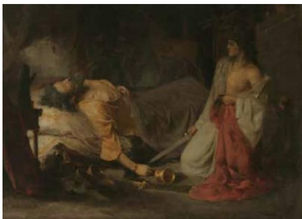
Slika 15. Bela Čikoš Sesija, Judita i Holoferno