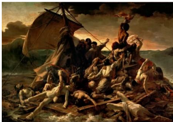
Slika 16. Théodore Géricault, Splav Meduze