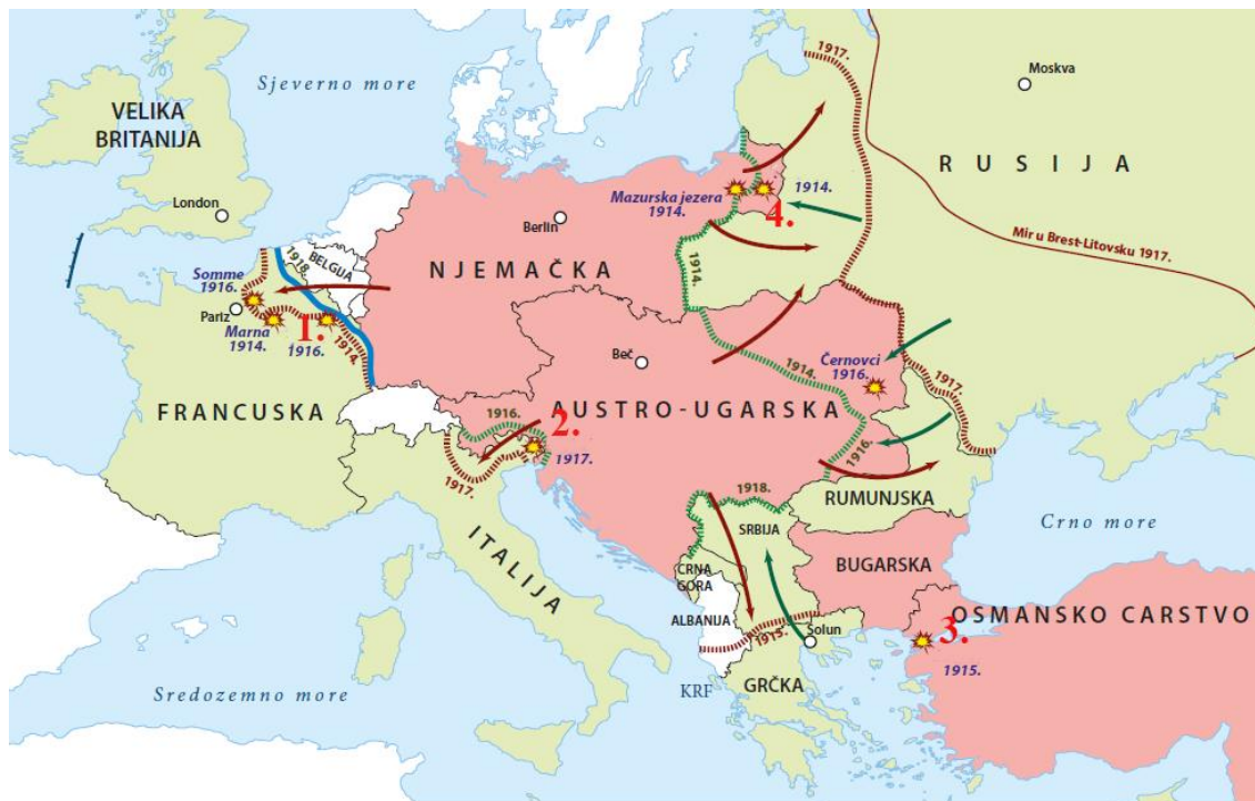
Zemljovid 2. Prvi svjetski rat

21. Pozorno prouči priloženi zemljovid i na prazne crte upiši bitke pored točnog broja s obzirom na njihovu lokaciju.