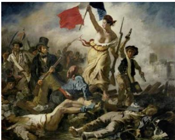
Slika 16. Eugene Delacroix, Sloboda vodi narod