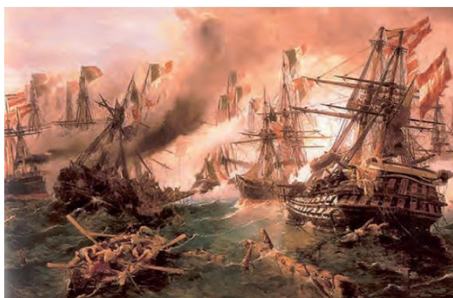
Slika 4. Bitka kod _____

Bitka se odigrala 24. lipnja 1859. godine, a u njoj su suprotstavljenim vojskama zapovijedala dva cara.