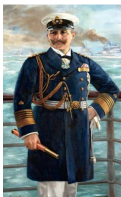
Slika 12. Car Vilim II.