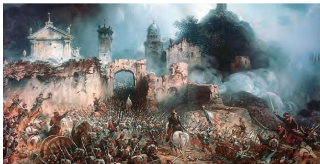
Slika 3. Bitka kod _____

Bitka se odigrala 24. lipnja 1859. godine, a u njoj su suprotstavljenim vojskama zapovijedala dva cara.