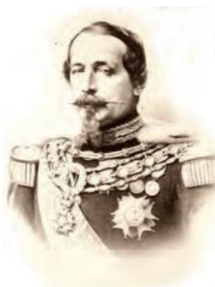
Slika 11. Car Napoleon III.