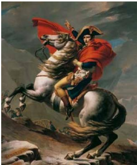
Slika 14. Jacques-Louis David, Napoleon prelazi Alpe

25. Pozorno prouči priložene slike umjetničkih djela i zaokruži broj slike uz onu koja pripada umjetničkom stilu neoklasicizma.