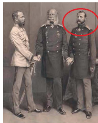
Slika 13. Car Aleksandar II. (zaokružen)